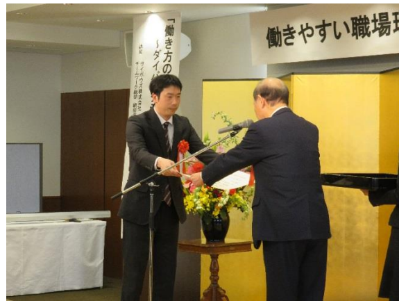
富山県知事より授与

富山県の「企業子宝率」が製造業平均 1.29 のところ、当社の企業子宝率は 1.54 と高く、男性の育児休暇の取得実績や、えるぼし（3段階目）の獲得、高い年次有給休暇取得率などが評価されての受賞となりました。